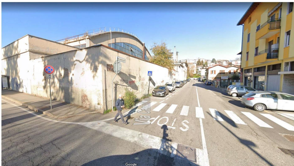
Figura 6 - Vista Angolo via Castoldi via Sanvito