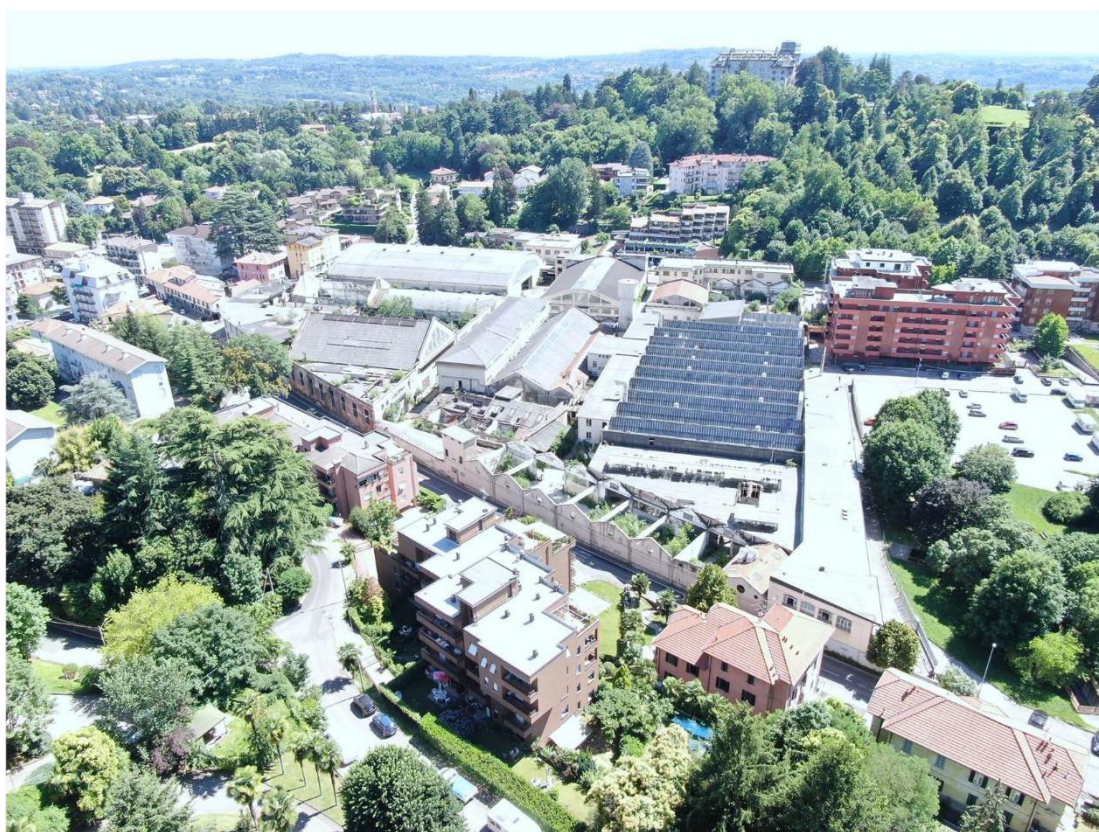
Figura 2 - Vista Aerea