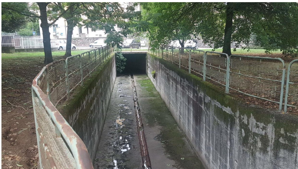
Figura 7 - Tratto del Torrente Vellone a monte della tombinatura in area ex-Aermacchi