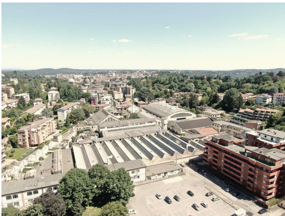
Figura 1 - Vista Area