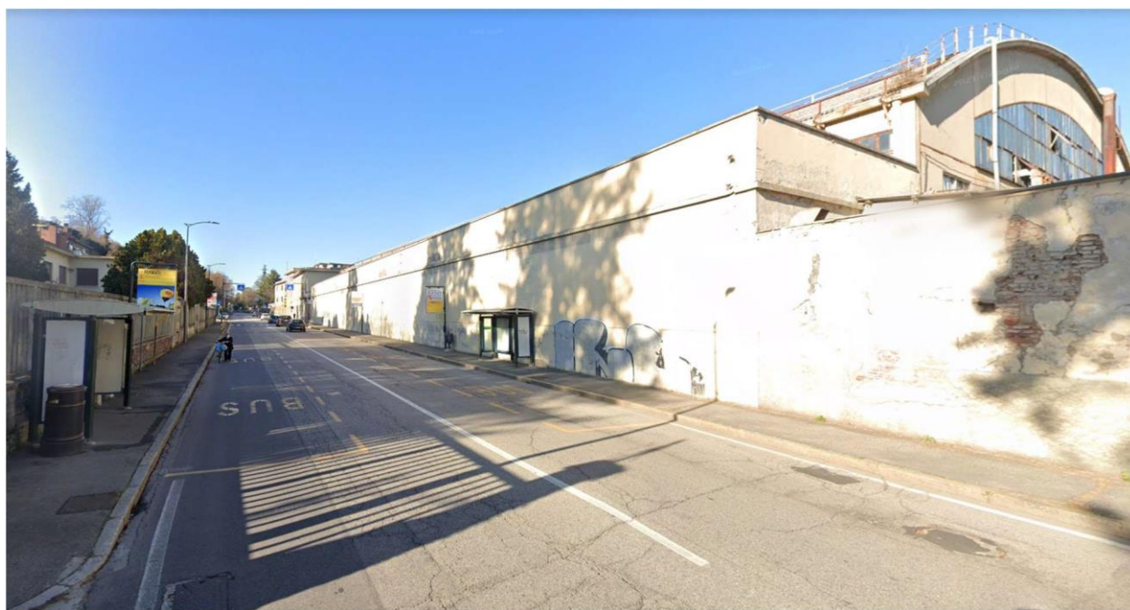
Figura 4 - Vista dell'area lungo via Sanvito