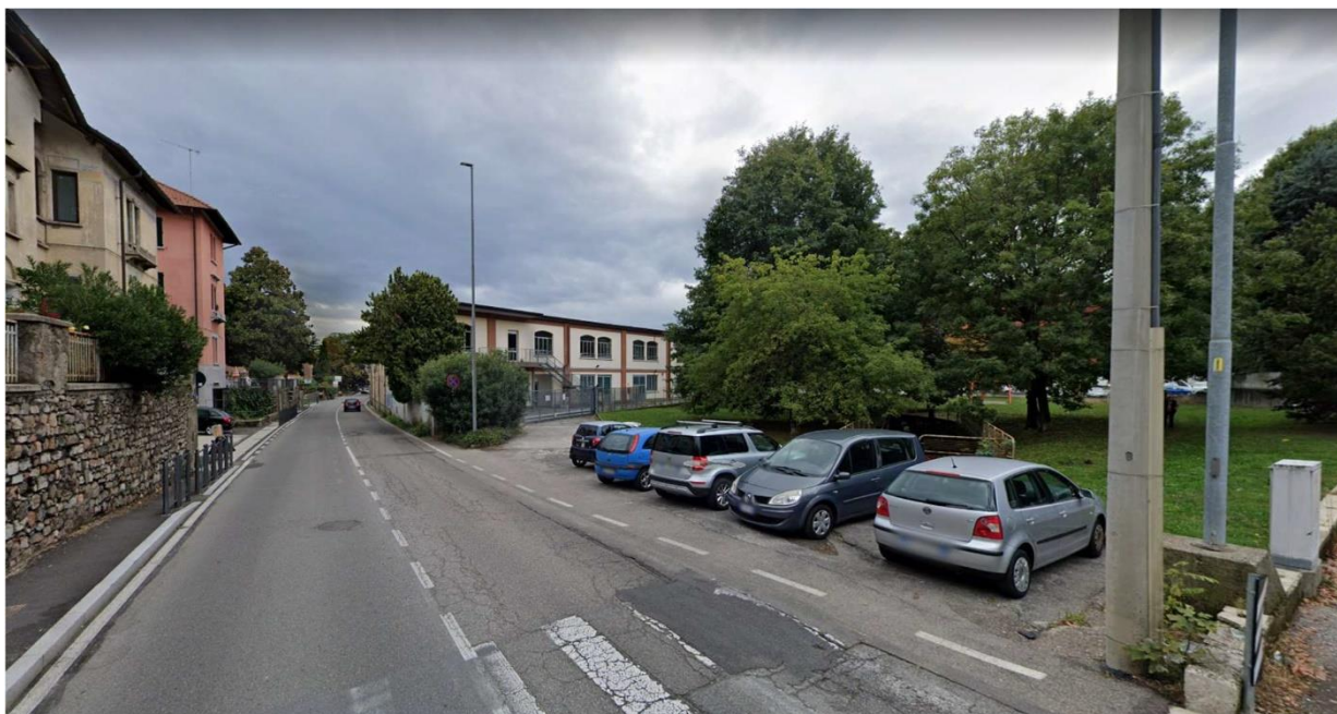
Figura 5 - Vista lato occidentale da via Crispi