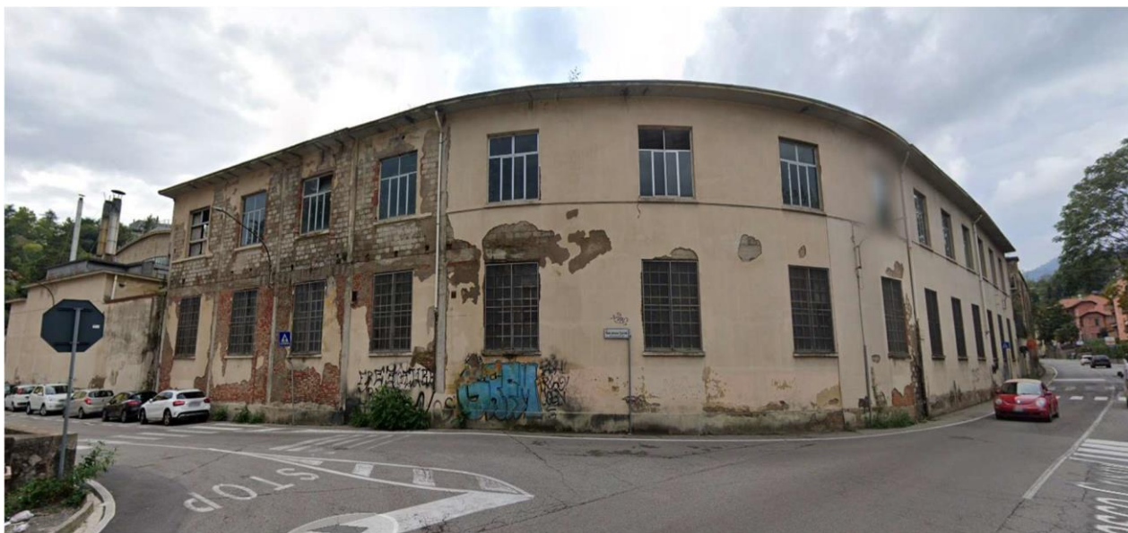
Figura 3 - Vista Angolo via Crispi - via Castoldi